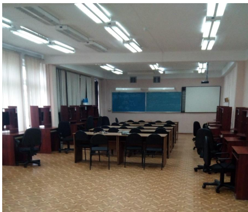
Оснащенность и благоустройство